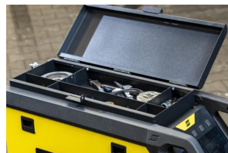
Opcjonalna górna skrzynka narzędziowa na akcesoria