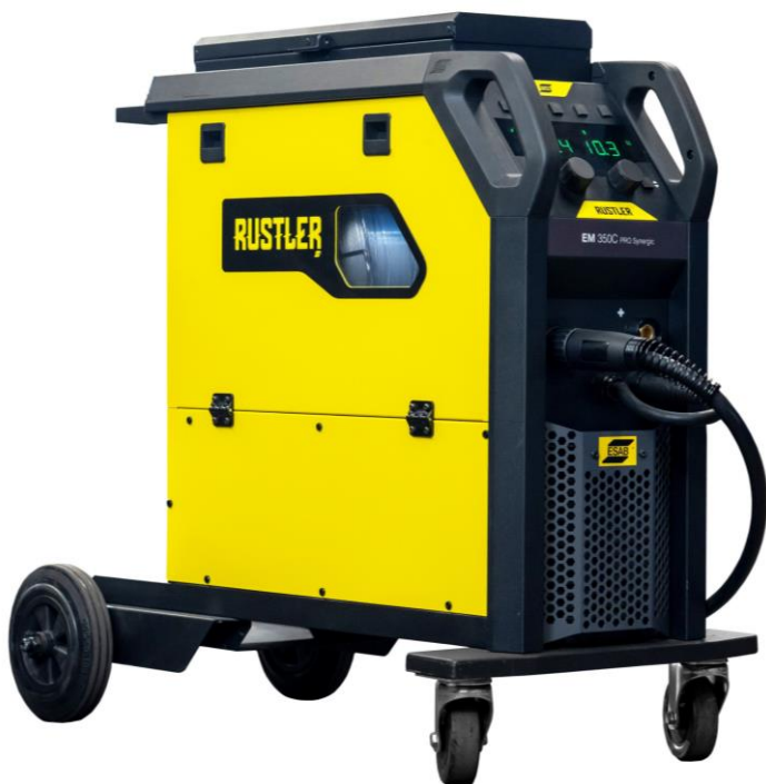
Rustler EM 350C PRO Synergic

Kompaktowe inwertorowe urządzenia Rustler MIG PRO to najlepszy wybór dla najbardziej typowych wyzwań spawalniczych. Wyposażone w najnowszą technologię inwertorową łączą niskie zużycie energii ze zoptymalizowaną wydajnością spawania.